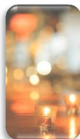
一般450cd ディスプレイ

高輝度のパネルを採用し、一般的な液晶より遥かに明るいため、屋外でも明るく見えます。バックライトを使う場合、明るさは増しますが、パネルの寿命が減りますので、光学フィルムをつけます。